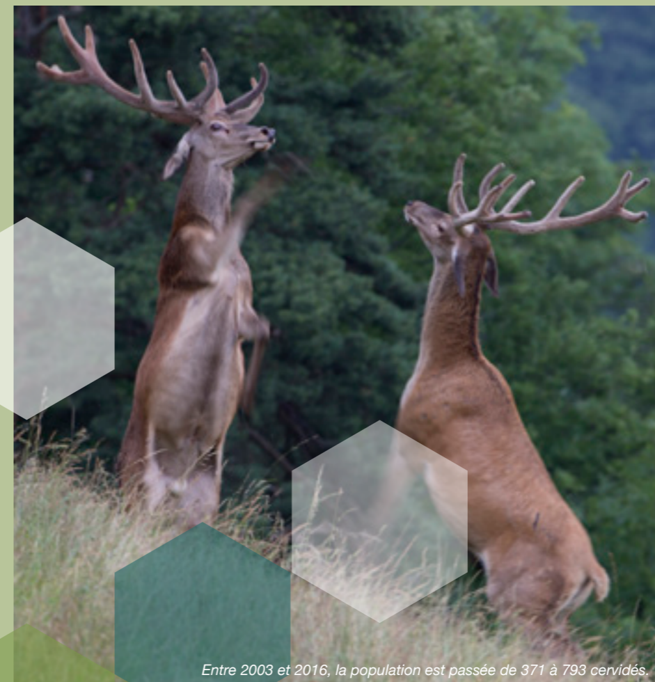
Entre 2003 et 2016, la population est passée de 371 à 793 cervidés.

Chaque année au début du printemps, les chasseurs organisent des comptages nocturnes de cervidés, en concertation avec la Direction départementale de l'agriculture, l'Office national des forêts et la Direction départementale du territoire. La période est idéale car c'est à ce moment que cerfs, biches, faons et autres mammifères à bois descendent des sommets, attirés par l'herbe fraîche, après une longue disette hivernale.