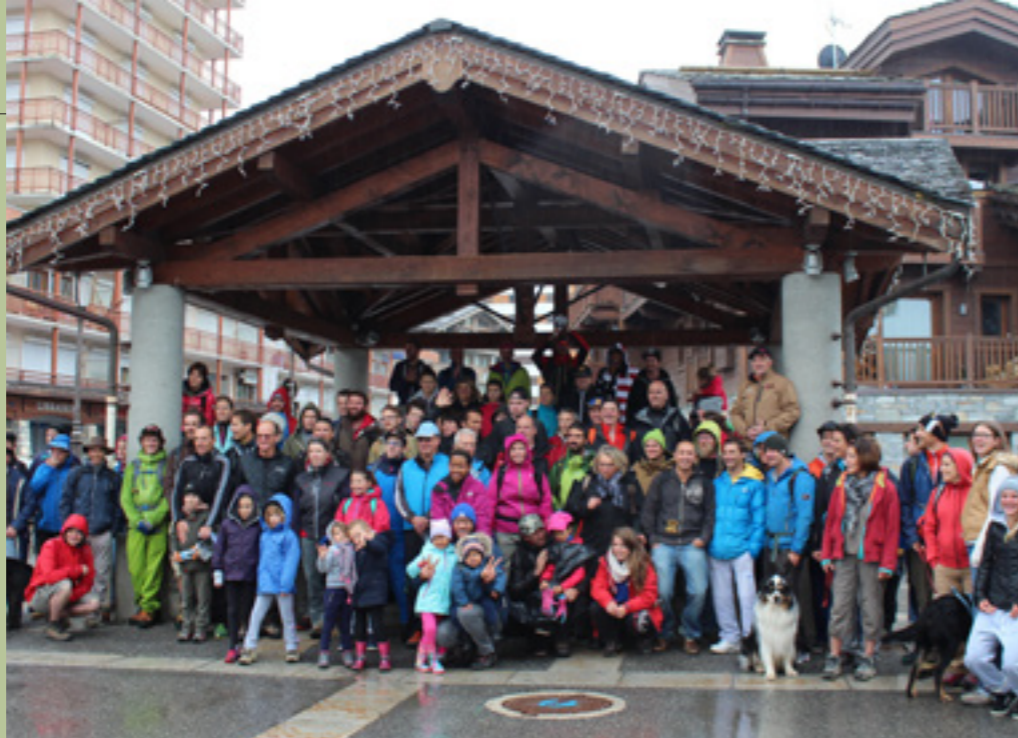
La traditionnelle photo de groupe avant le départ : des volontaires motivés !

« La montagne est belle, respectons-la » ! Tel est le credo de l'association Man of the Day, qui œuvre depuis 9 ans sur le territoire de Courchevel pour préserver l'écrin de nature qui nous entoure. Leur traditionnelle opération « Montagne propre » réunit chaque année de nombreux volontaires pour le grand ménage de printemps !