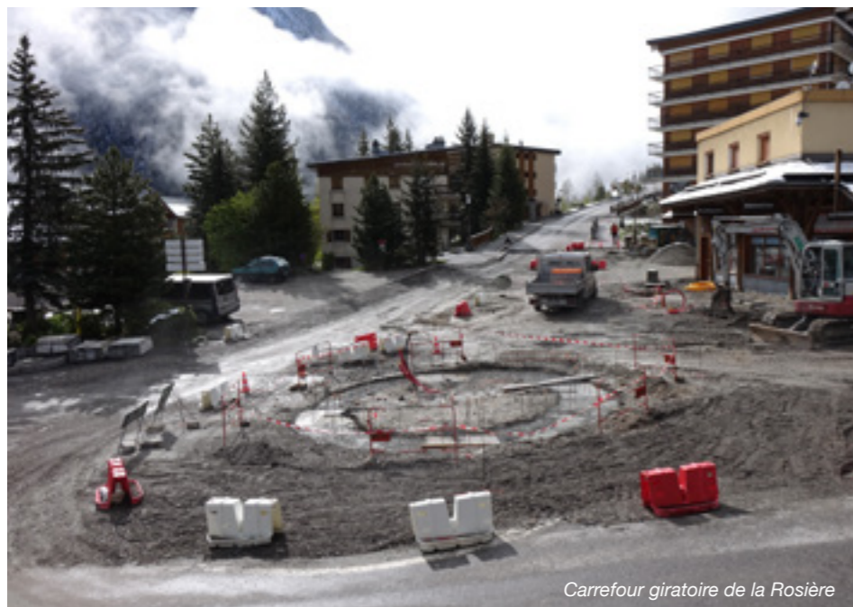
Carrefour giratoire de la Rosière