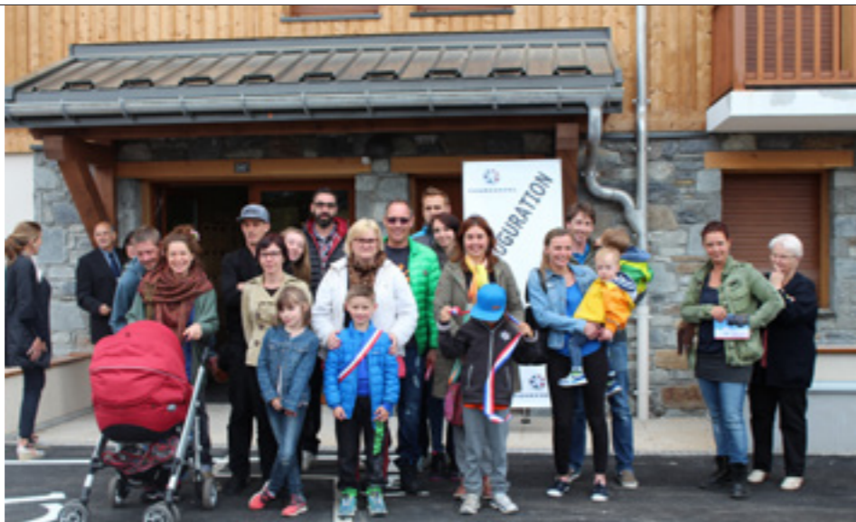
La Manda, rue du Plantret à Courchevel, a été inaugurée le 15 juin 2016 en présence des premiers locataires.

Après l'achèvement récent de La Manda à Courchevel, la commune compte désormais 297 logements sociaux permanents. L'objectif de la politique communale, dont le cap est maintenu depuis les origines de la station, est de favoriser l'accès au logement afin de maintenir la population sur le territoire.