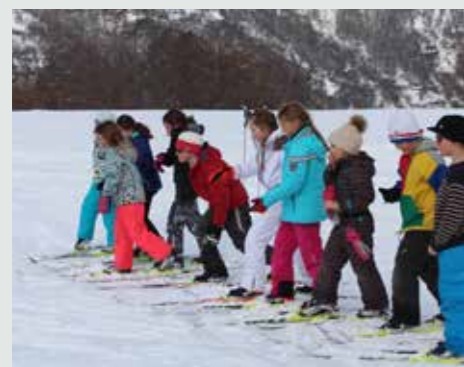
Jouer à l'épervier, mais en ski de fond ! Une façon ludique de se familiariser avec l'équipement.