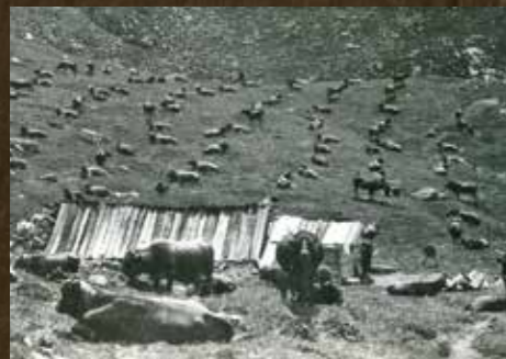
LA PACHONNÉE : Chaque soir, on attachait les vaches à des piquets (« pachons ») de façon à ce qu'elles soient prêtes pour la traite, soir et matin. Equipé de son « botte-à-cul », le bon montagnard traitait 20 à 25 vaches en 3 heures. Le troupeau nécessitait ainsi la présence d'une dizaine d'hommes (aujourd'hui, une machine en fait 185, avec 2 hommes). Les Avals en 1957

Autrefois appelée « la commune aux 1000 vaches », Saint-Bon était une terre agricole sur laquelle régnaient les Tarines. Toujours présentes, elles permettent de produire du beaufort sur la commune depuis plusieurs siècles.