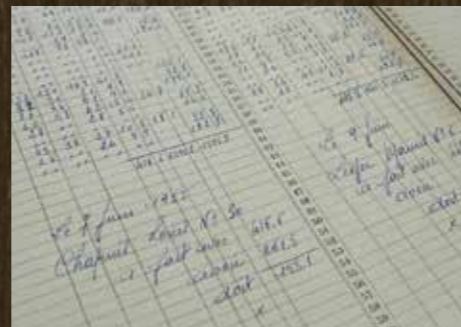
LE CAHIER DE PESÉE : De septembre à juin, le lait qui n'était pas consommé dans la famille était apporté à la fromagerie, où il était pesé. Chaque pesée était consignée dans un cahier. De la tomme était ensuite fabriquée, puis redistribuée aux familles en fonction de la quantité de lait apporté. Celui-ci constituait donc une vraie monnaie d'échange. Cahier de 1952

Au début du XX e siècle, Saint-Bon comptait plus de bêtes (vaches et chèvres) que d'habitants et l'agriculture était la principale source de revenus. Pour les anciens du village, c'était en quelque sorte « la civilisation de la vache ! » Chaque famille avait au moins une ou deux bêtes, et un « or blanc » existait déjà à Saint-Bon... le lait !