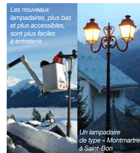
Les nouveaux lampadaires, plus bas et plus accessibles, sont plus faciles à entretenir.

En 2016, la gestion de l'éclairage a été internalisée grâce à la création d'un service électrique communal composé de deux agents. Par ailleurs, le nombre d'interventions pour l'entretien sera réduit grâce à la longévité de la led (10 fois supérieure aux ampoules traditionnelles). Ces choix permettront de réaliser une économie de 100 000 € par an tout en améliorant l'efficacité du service.