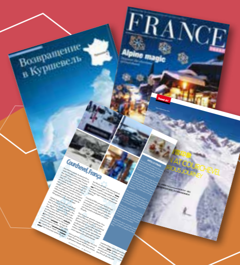
Brésil, Grande-Bretagne, Russie, Chine... Le monde entier parle de Courchevel !